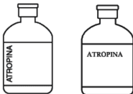
Figura 3: Impresso paralelo e perpendicular ao maior eixo do recipiente.

6.1.12. Quando a marca, nome genérico, concentração e volume total puderem ser impressos dentro de 180° da circunferência do recipiente, a impressão pode ser feita de forma perpendicular ao seu maior eixo.